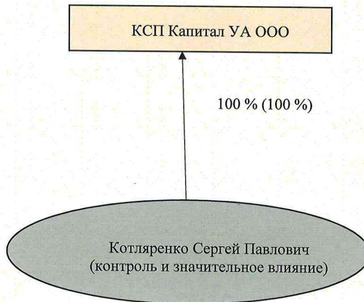
СХЕМА ВЗАИМОСВЯЗЕЙ АКЦИОНЕРОВ (УЧАСТНИКОВ) НФО И ЛИЦ, ПОД КОНТРОЛЕМ ЛИБО ЗНАЧИТЕЛЬНЫМ ВЛИЯНИЕМ КОТОРЫХ НАХОДИТСЯ НФО